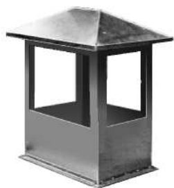
Wyrzutnia dachowa WPD typu A ▲ do prostokątnych szachtów wentylacyjnych.

Atesty Higieniczne: HK/B/1121/02/2007 HK/B/1121/04/2007