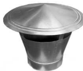
Wyrzutnia dachowa WPD typu C ▼ do okrągłych szachtów wentylacyjnych.

SMAY Sp. z o.o. / ul. Ciepłownicza 29 / 31-587 Kraków tel. +48 12 680 20 80 / fax. +48 12 680 20 89 / e-mail: info@smay.eu